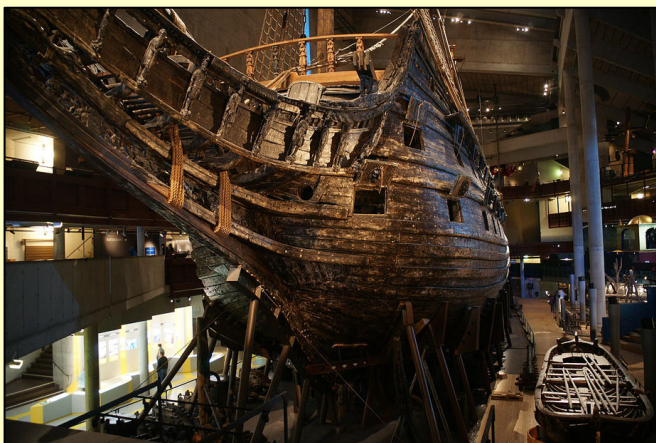
Figura 2: El Vasa, ya expuesto en su museo

Como hemos visto, la conservación in situ no siempre resulta la opción más conveniente, y casi nunca lo es en pecios en aguas someras y de reciente hundimiento. Estos derelictos están muy expuestos a la acción degradadora del mar y todavía no han alcanzado la fase de estabilización. Además en ellos